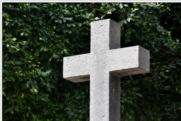
Protagonist Felix hat nie an Gott geglaubt, an Schutzengel schon gar nicht.

Felix wünscht sich eigentlich nur eins. Er will wieder wissen, was er angestellt hat. Weil ihn der Ehrgeiz packt, bringt er die theoretische Prüfung mit links hinter sich. Auch das Fliegen klappt recht schnell. Ein paar blaue Flecken, und Schutzengelanwärter 123 schwebt ein paar Zentimeter über den Boden. Schneller als gedacht, steht Betreuer Erwin mit zufriedenen Grinsen vor ihm und hat den ersten von drei Einsatzplänen dabei.